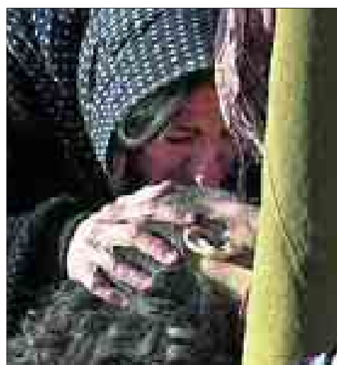
Una mujer besa a un familiar muerto en el sismo.

Todos los destinos para el calor y el frío