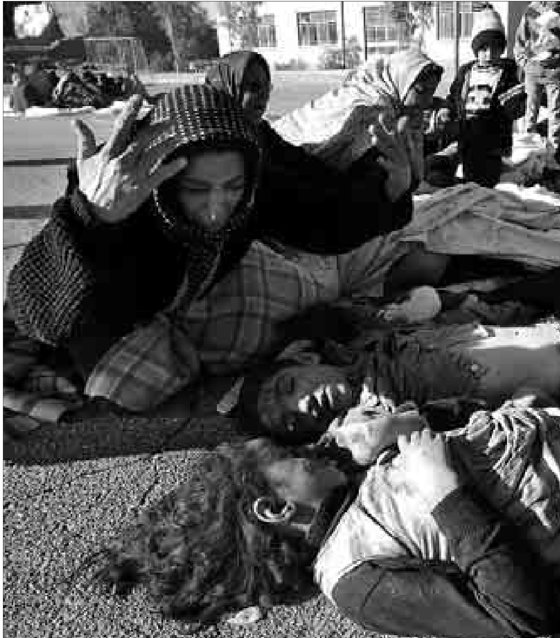
Varias mujeres lloran ante los cadáveres de niños que murieron ayer en el terremoto de Bam.

Decenas de cuerpos rescatados de los escombros yacían sobre las ruinas de la ciudad, mientras los supervivientes lloraban en torno a los cadáveres de sus familiares y clamaban contra la lentitud de las operaciones de salvamento.