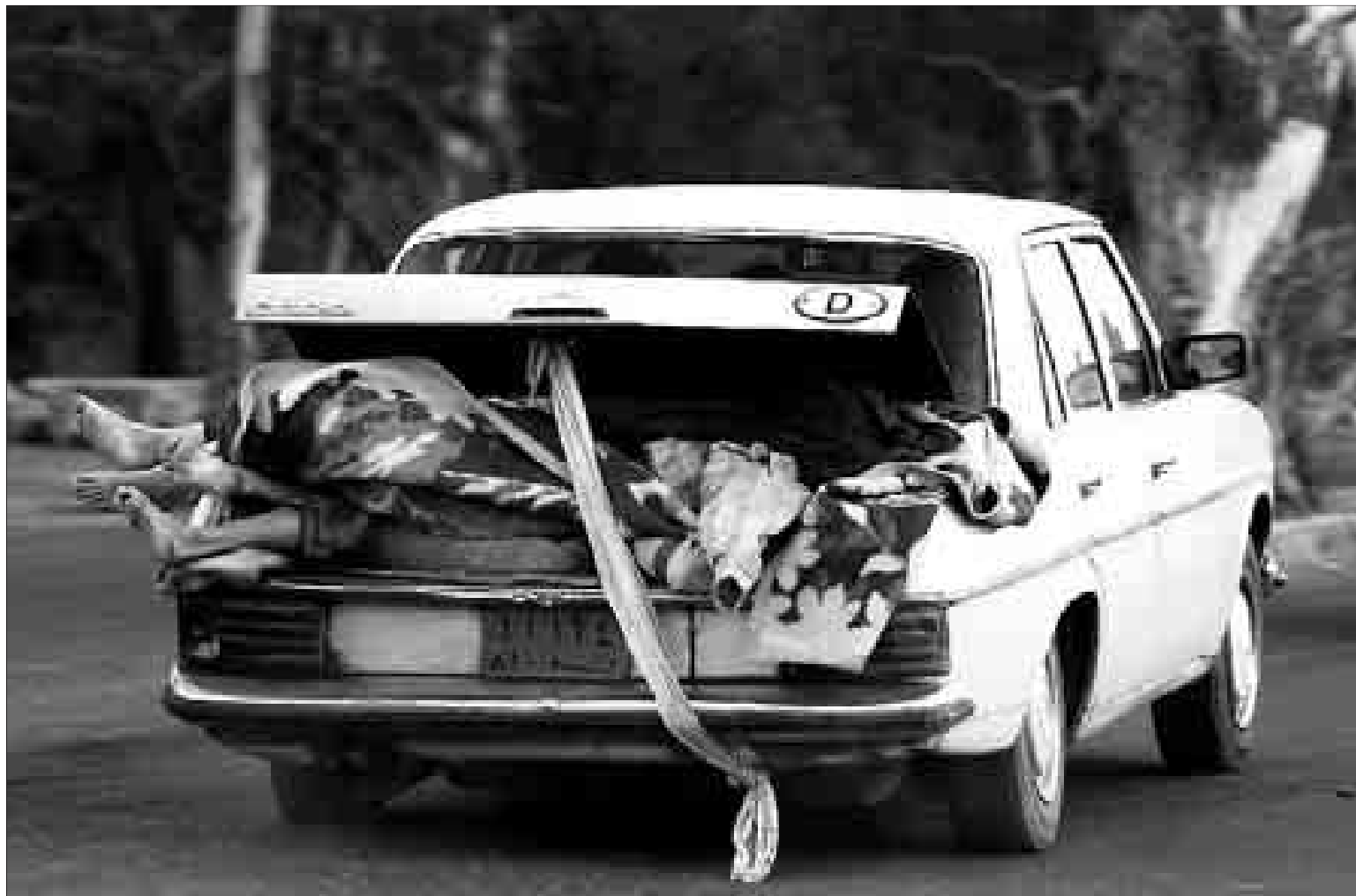
Los cadáveres de algunas de las víctimas del terremoto que ayer sacudió Bam se apilan en el maletero de un coche.