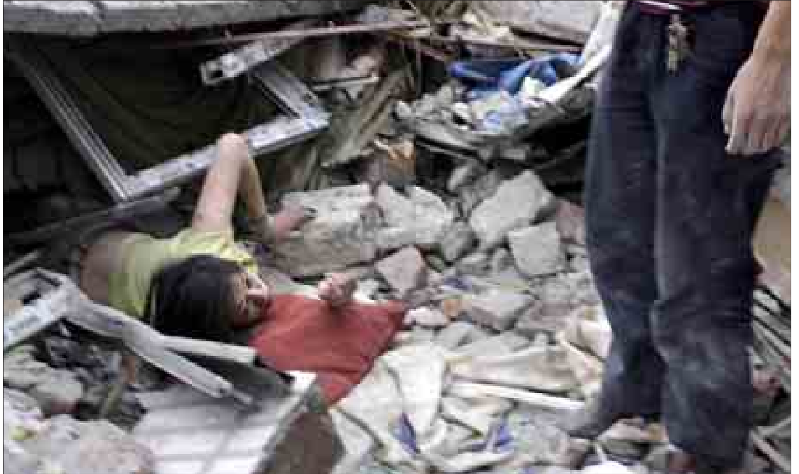
Una mujer trata de escapar de entre los escombros de un edificio de Dujiangyan, a sólo unos kilómetros del epicentro del terremoto que ayer asoló Sichuan.

A diferencia de Birmania, donde el caos y la precariedad de medios ha agravado las consecuencias del ciclón Nargis, el Gobierno chino cuenta con un eficiente sistema de emergencias y la capacidad para desplegar a un gran número de equipos de rescate en un breve espacio de tiempo. De esta forma, un contingente de 5.000 soldados empezó a llegar al área cercana a la zona cero para reforzar las labores de