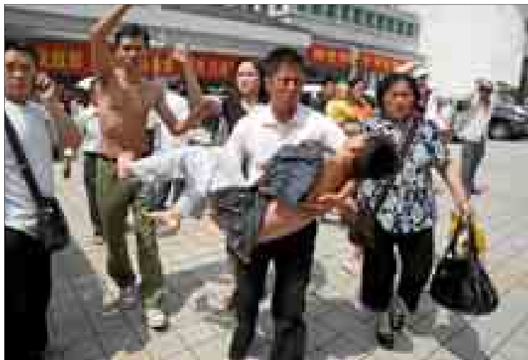
Una familia evacua a su hijo de un hospital de Chongqing dañado por el seísmo.

rescate. La provincia de Sichuan, situada al oeste de China y fronteriza con el Tíbet, tiene más de 100 millones de habitantes y cuenta con núcleos donde la densidad de población hace temer un rápido in-