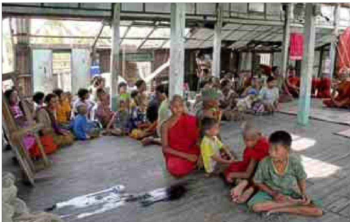
Víctimas del ciclón 'Nargis', reunidas en el monasterio budista de la localidad birmana de Kyi Bui Khaw.

Las bolsas de comida han sido donadas por una familia acomodada de Rangún. El arroz que hierve en las enormes cazuelas de la cocina lo han recibido de los vecinos de la zona, que a pesar de hallarse en una situa-